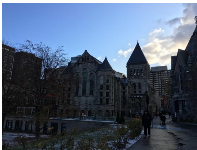
図3 モントリオールの風景

11月の中旬にモントリオールに行ってきた。モントリオールに着いて驚いたことが、標識やメニューなどほとんどがフランス語だったことである。英語の勉強を行っている間は、英語で話すの大変だな、と思うことが多々あったが、海外にきて初めて英語で話せて助かった、と思えた旅になった。モントリオールの町並みはヨーロッパ風で、トロントとはまた違った良さを楽しむことができた。