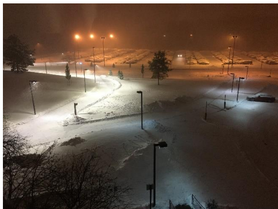
図1 部屋からの景色

11月上旬に雪が降り、私が持っている靴では雪道を歩けなかったためブーツを買った。しかしそれ以降11月中に雪が降ったのはわずかだったため、結局11月中ブーツは1回も使わなかった。12月は雪関係なくブーツを履いて学校に行こうと思う。今月は学期末に近い上に、Thanks Giving で連休になるため、連休前の授業がとても大変だった。