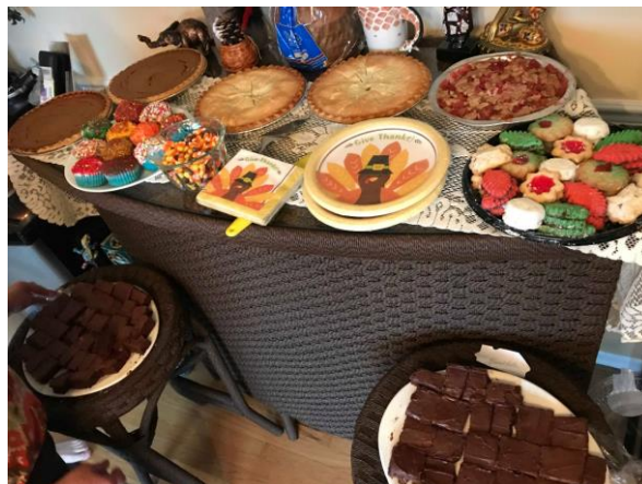
図5 たくさんのデザート