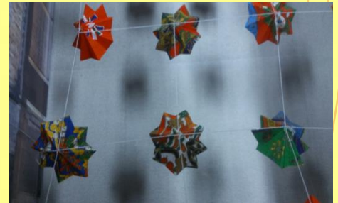
図4 十字による傘の固定