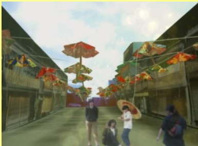
図2 模型制作・イメージ図