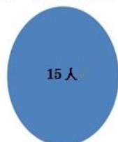
表1 西茶屋街の印象アンケート