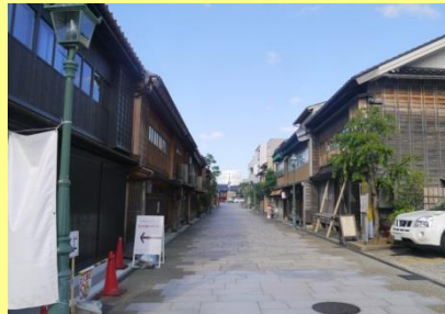
図3 西茶屋街の敷地調査