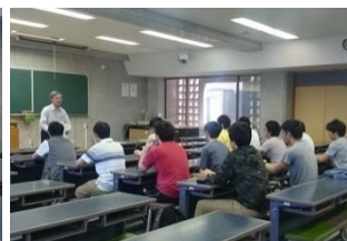
「安全マインド・アワード」表彰式の様子