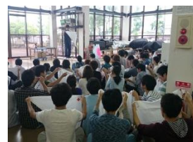
救急法講習会の様子

また、午後からは救急法講習会を行いました。救急法講習会では日本赤十字社石川県支部から講師をお招きして、傷病者への対処・搬送法や熱中症対策等について指導していただきました。夏に多くのプロジェクトが大会を控えている事もあり、例年この時期はプロジェクト活動が活発になります。夢考房では、プロジェクト活動で不測の事態が発生した時に適切に対処できるよう、活動が活発になるこのタイミングで毎年救急法講習会を行っています。今年度も数多くの学生が参加しました。