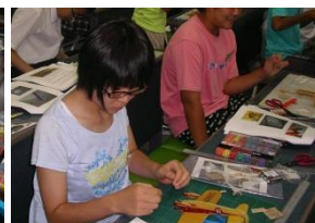
工作を楽しむ参加者の様子