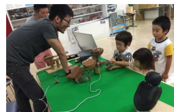
左:犬型ロボット 右:フクロウ型ロボット

犬型ロボットは、リモコンの各ボタンを押すことで、お座りやお手、前後に歩く、ボールを蹴るなど数種類の動作が可能です。実際に動かした子ども達からは大好評でした。フクロウ型ロボットについては、まだ開発途中のため、展示で動作を見て頂くだけとなりました。21日は夏休み中ということもあり来館者も多く、大変盛況でした。一方の28日は、今年から始業日が早い小学校があった影響か21日に比べ小学生は少なめでしたが、幼稚園の団体が来館していたことから、園児にもロボットとのふれあいを楽しんでもらうことができました。より多くの子ども達にロボットとふれあってもらうためには日程調整等の課題もありますが、今回の展示でたくさん子ども達にロボットとのふれあいを楽しんでもらえたことは、学生にとって大きな収穫でした。